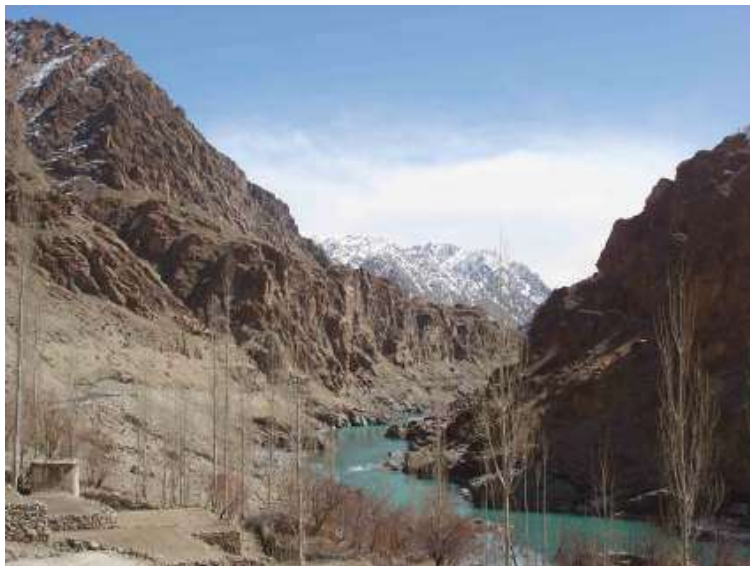
Région de Da Hanu où l'Indus coule de son bleu turquoise vers le Pakistan tout proche.

La région est également connue pour ses abricots qui constitue une culture primordiale en terme de revenus mais également du point de vue nutritionnel puisqu'une fois séchés ils sont les seuls fruits disponibles durant l'hiver au Ladakh.