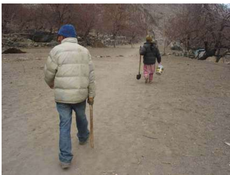
En attendant les beaux jours on prépare les champs et on nettoie les canaux d'irrigation.