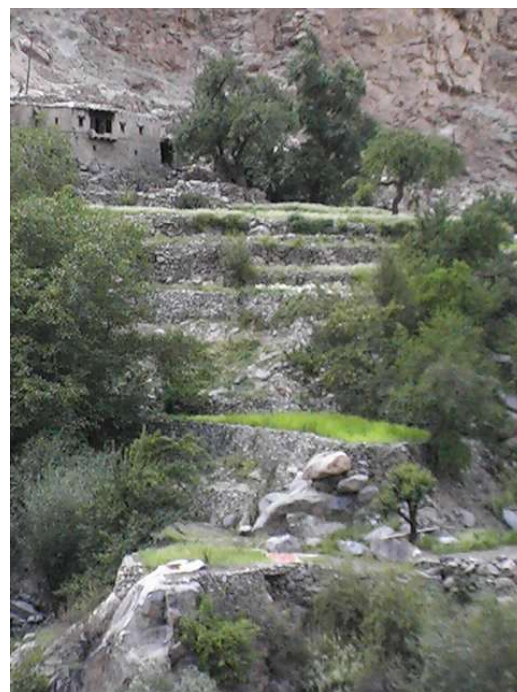
Séchage des abricots sur les toits de maison et terrasses qui surplombent l'Indus.